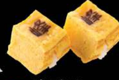
35 峰玉子 $14 峰玉子 MI-NE Egg