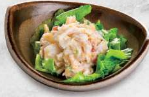
223 北寄貝沙律(小鉢) $32