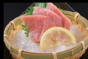
214 吞拿魚腩刺身 $140