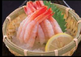
211 甜蝦刺身 $45