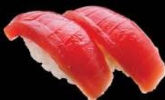
73 吞拿魚 $36 まぐろ Tuna