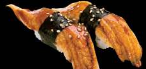
57 海鰻魚 $26 穴子 Sea Eel