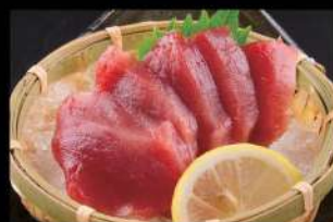
213 吞拿魚刺身 $55