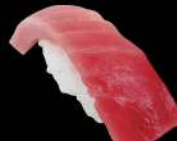
77 吞拿魚中腩 $32 中トロ Medium Fatty Tuna