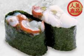
113 八爪魚芥辣 $18