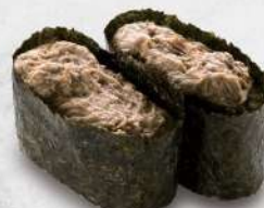
117 螃蟹羔醬 $22