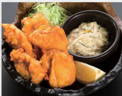
197 炸雞 $39