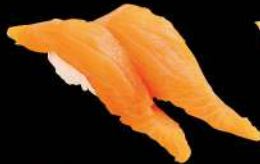
41 挪威三文魚 $14 ノルウェーサーモン Norway Salmon