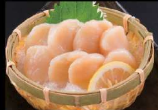
208 帶子刺身 $55