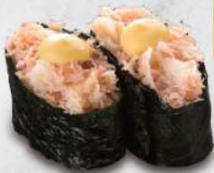
114 蟹肉 $18