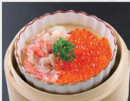
183 極上蒸蛋 $48

極上茶碗蒸し Savory Egg Custard with Salmon Roe