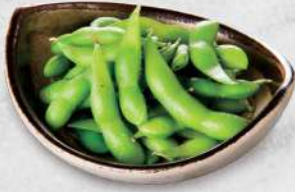
221 枝豆 $28