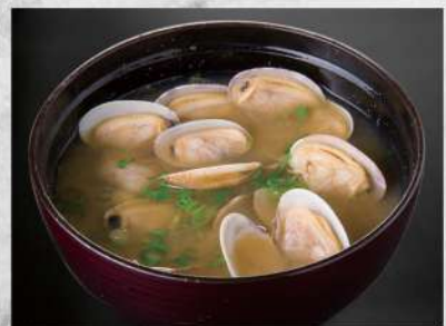
234 大盛蛤仔湯 $28