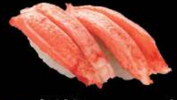
37 蟹柳 $16 カニカマ Steamed Fish Pasted