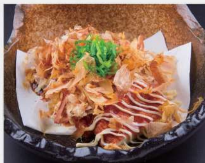
187 焼餅風味炸魚餅 $39

お好み焼き風薩摩揚げ Okonomiyaki Style Deep Fried Fishcake