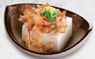
224 木魚花凍豆腐 $28