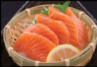
207 挪威三文魚刺身 $45