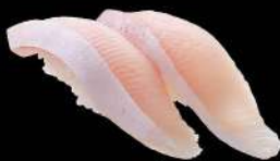
71 油甘魚腩 $38 ハマチトロ Yellowtail Toro