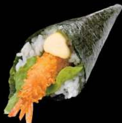
133 炸蝦手卷 $24