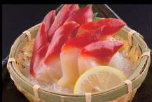
212 北寄貝刺身 $45