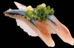
47 秋刀魚 $18 サンマ Mackerel Pike