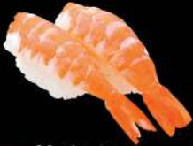
29 熟海老 $16 熟エビ Boil Shrimp