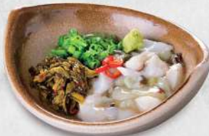
222 自家製八爪魚芥辣 $32