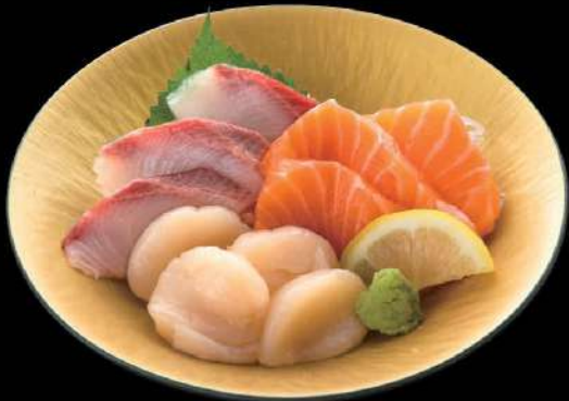
215 三点刺身盛 $98