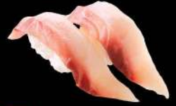
49 峰池魚 $22 峰あじ MI-NE Horse Mackerel