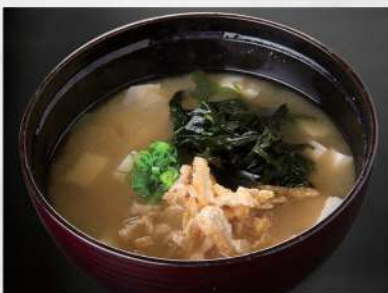
231 麵豉湯 $16