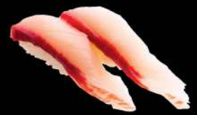
70 油甘魚 $28 ハマチ Yellowtail