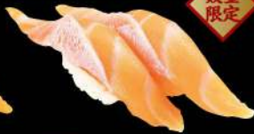
43 挪威三文魚腩 $22 ノルウェーサーモントロ Norway Salmon Toro