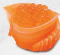
123 親子卷 $18