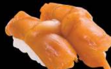
54 赤貝 $22 赤貝 Ark Shell