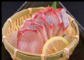
209 油甘魚刺身 $45