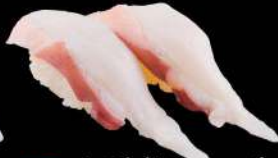
33 八爪魚 $16 たこ Octopus