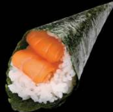
129 三文魚手卷 $18