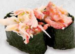
115 北寄貝沙律 $18