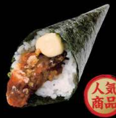
137 軟殼蟹手卷 $32