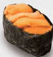
122 海胆 $28