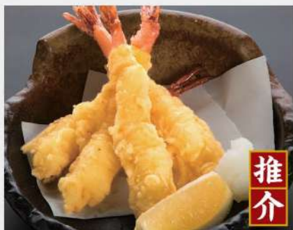
202 蝦天婦羅 $49

極上茶碗蒸し Savory Egg Custard with Salmon Roe