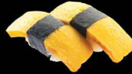
25 玉子 $12 玉子 Egg