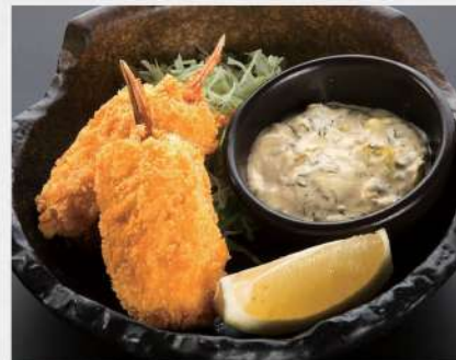
200 蟹肉忌廉薯餅 $39