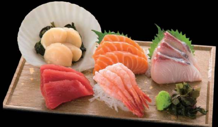
216 五点刺身盛 $158