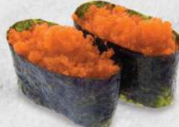
111 飛魚子 $18