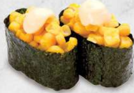
109 粟米沙律 $12