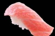
79 吞拿魚腩 $38 大トロ Fatty Tuna