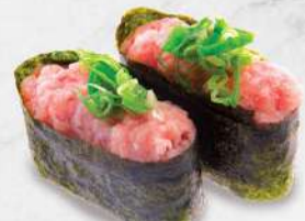
119 葱粒吞拿魚腩 $28