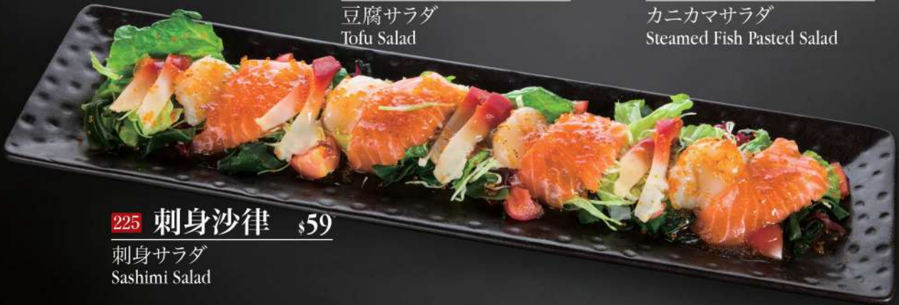
225 刺身沙律 $59