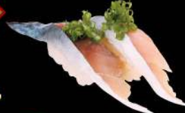
44 醋鯖魚 $16 ぶさば Mackerel