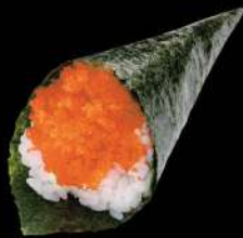
127 飛魚子手卷 $18