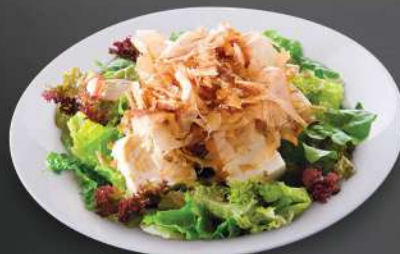
227 豆腐沙律 $39