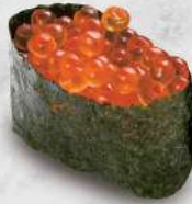
121 三文魚子 $22