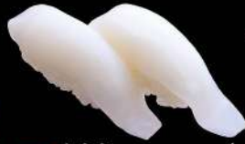
31 墨魚 $14 ヤリイカ Squid