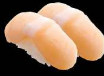
66 帶子 $34 ホタテ Scallop