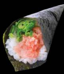
134 葱粒吞拿魚腩手卷 $28