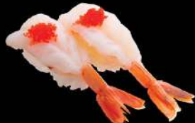
63 千尋海老 $24 千尋えび Chihiro Shrimp