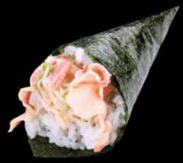
131 北寄貝沙律手卷 $22