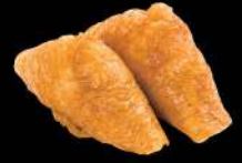
27 腐皮 $12 いなり Inari