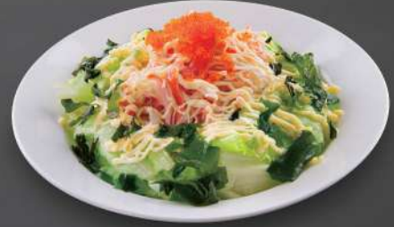
229 蟹柳沙律 $39