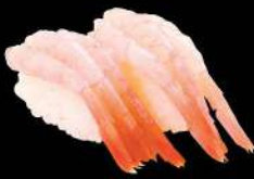
61 甜蝦 $18 甘エビ Sweet Shrimp