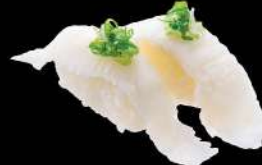
69 魚背 $28 エンガワ Fish Porch