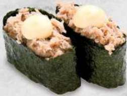
108 吞拿魚沙律 $12