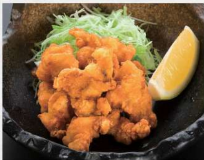
194 炸墨魚軟骨 $39

お好み焼き風薩摩揚げ Okonomiyaki Style Deep Fried Fishcake