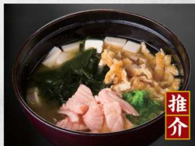
232 三文魚麵豉湯 $18