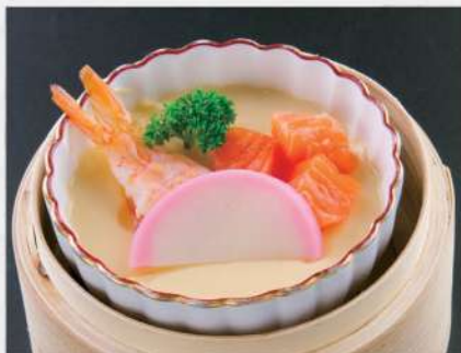
181 等等蒸蛋 $32